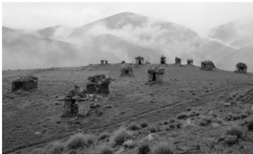
Figura 1. Vista panorámica de las chullpas de Wat'amarka

Las arquitecturas funerarias de Wat'amarka son visibles en toda su extensión a las faldas de la montaña desde la carretera Coasa-Esquena provincia de Carabaya (Puno). 3 Se encuentra a unos 3500 a 4000 metros de altura; el sector de las viviendas se sindicaban a grandes canchones de piedras y corrales que ya están en escombros.