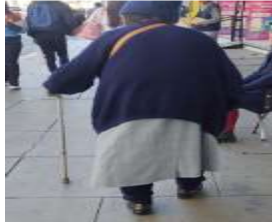
Fotografía distrito Cercado- Calle Santo Domingo