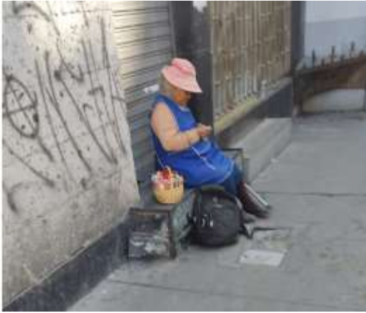
Fotografía distrito Cercado- Calle Santo Domingo