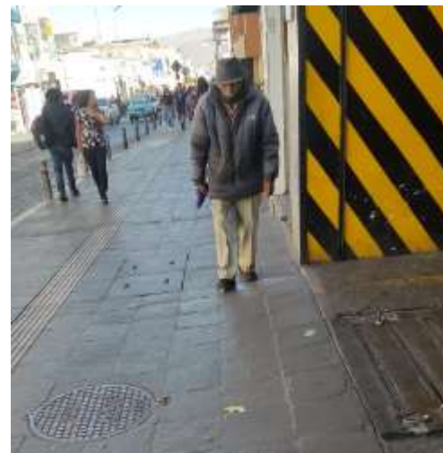
Fotografía distrito Cercado- Calle Santo San Camilo