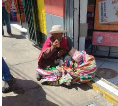
Fotografía distrito Cerro Colorado- Zamacola