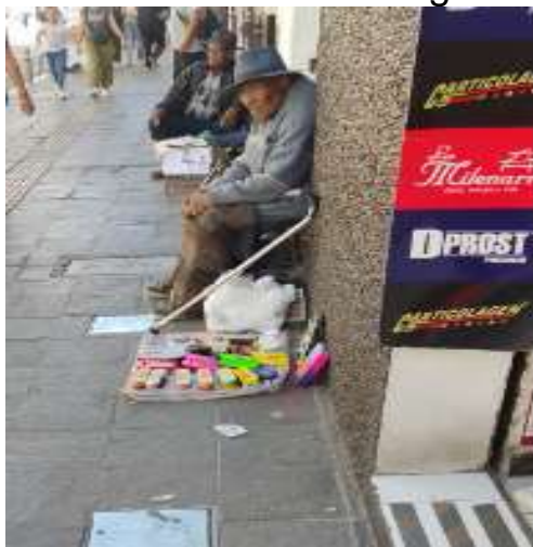
Fotografía distrito Cercado- Calle San Camilo