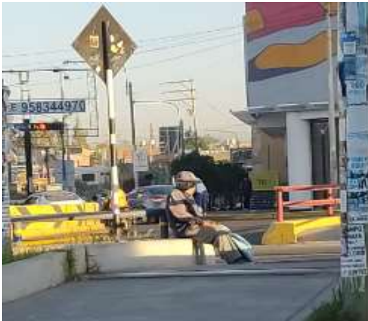
Fotografía distrito Bustamante Rivero - Lambramani