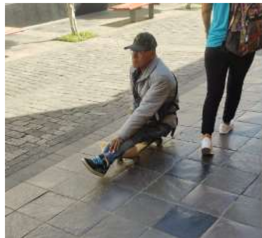
Fotografía distrito Cercado- Calle Mercaderes