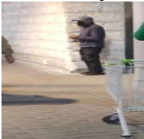
Fotografía distrito Paucarpata - Porongoche